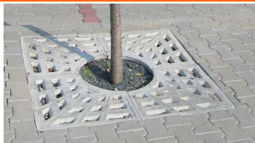
Vegetační mříž kruhová D150