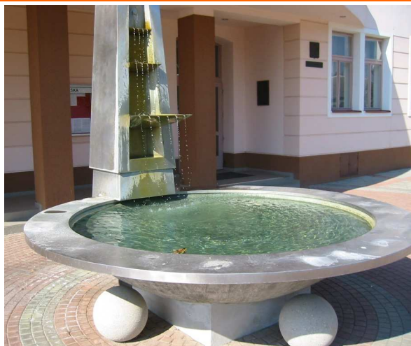
Kašna – Velké Pavlovice